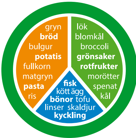
Tallriksmodell för den som rör sig enligt rekommendationerna på sidan 4.