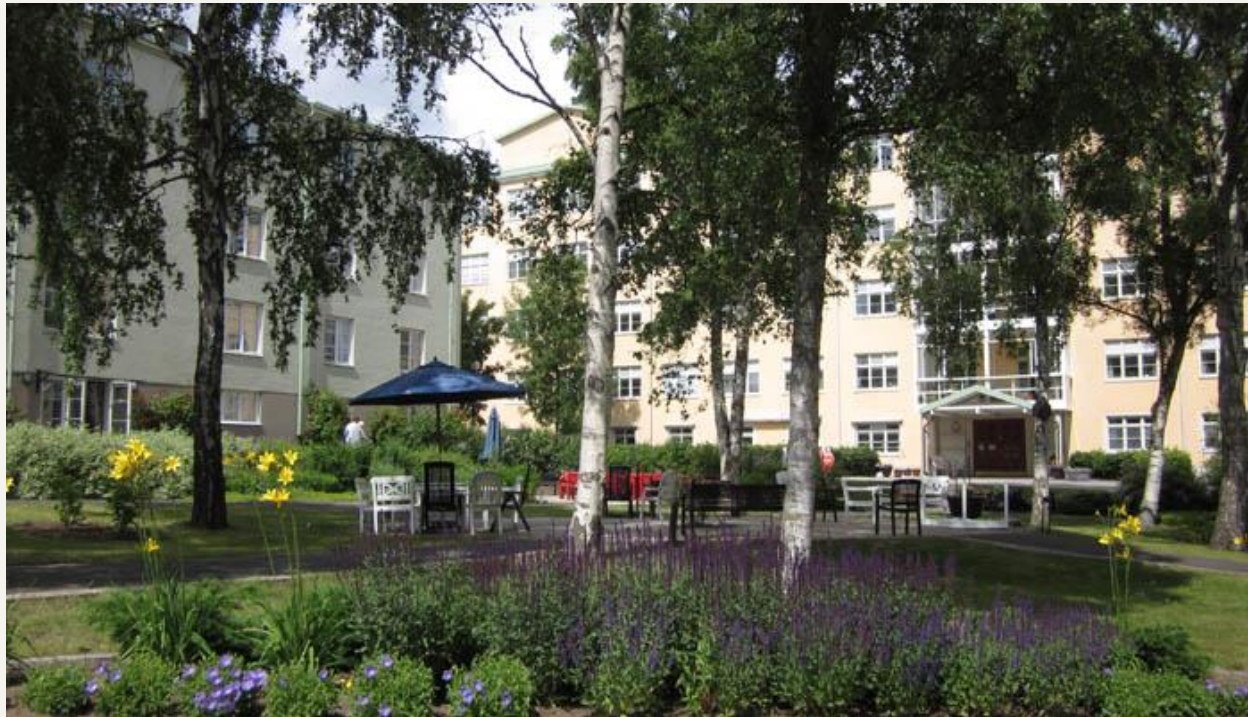
Stureby vård- och omsorgsboende