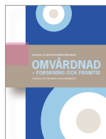
Omvårdnad – forskning och framtid