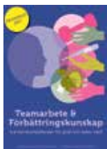
Teamarbete och förbättringskunskap