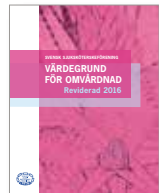
Värdegrund för omvårdnad