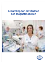
Ledarskap för omvårdnad och Magnetmodellen