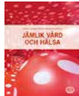
Jämlik vård och hälsa