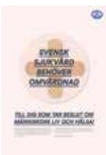
Kampanjtidning – Svensk sjuk- vård behöver omvårdnad