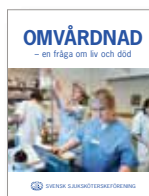
Omvårdnad – en fråga om liv och död