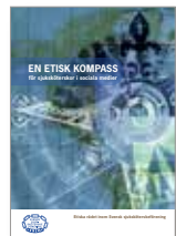
En etisk kompass för sjuksköterskor i sociala medier