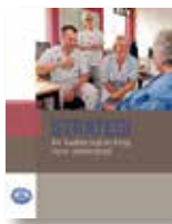
Strategi för kvalitetsutveckling inom omvårdnad