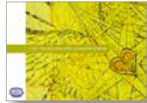
ICN:s etiska kod

– Vi träffar politiker, beslutsfattare och svarar på remisser från departement och myndigheter. Som opinionsbildare arbetar vi för en god kunskapsbaserad omvårdnad på lika villkor och för att sjuksköterskor ska ha goda förutsättningar till professionell utveckling.