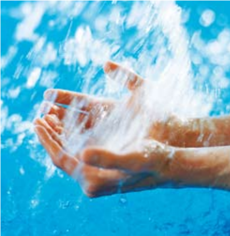
Per Magnus Persson/Johnér