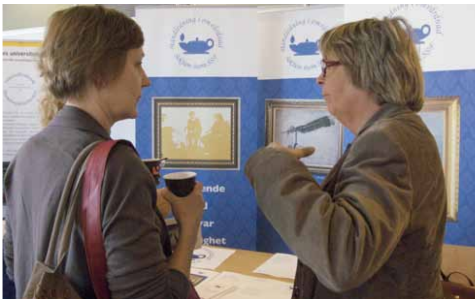
HiOs monter på konferensen Lust och Kunskap gav många tillfällen till nya kontakter.