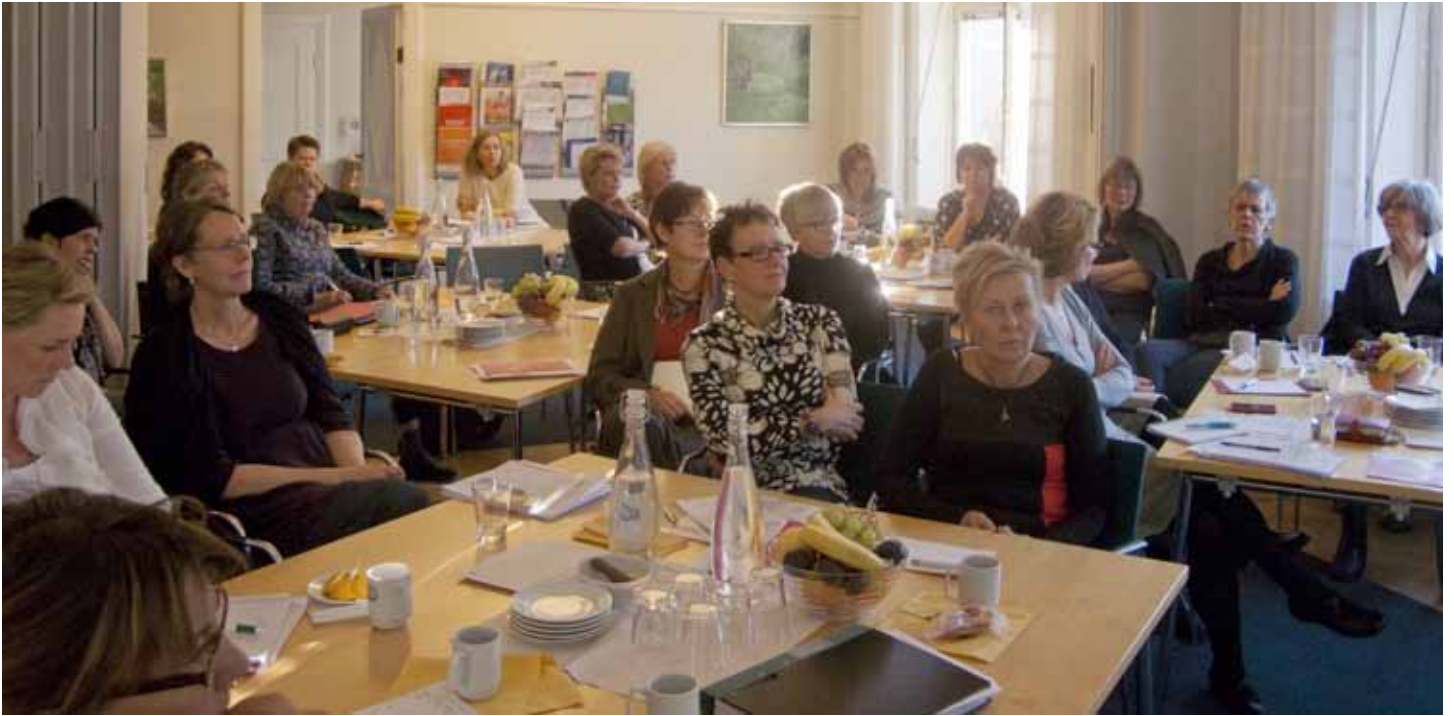
Ett 20-tal handledare deltog i Värdegrundsdagen, ett samarbetsprojekt mellan Svensk Sjuksköterskeförening och HiO.