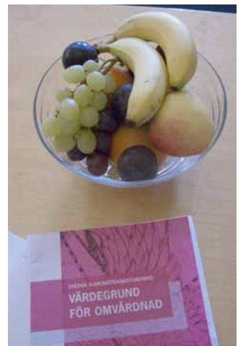
Fruktsam projekt! Värdegrundsdagen gav mersmak.